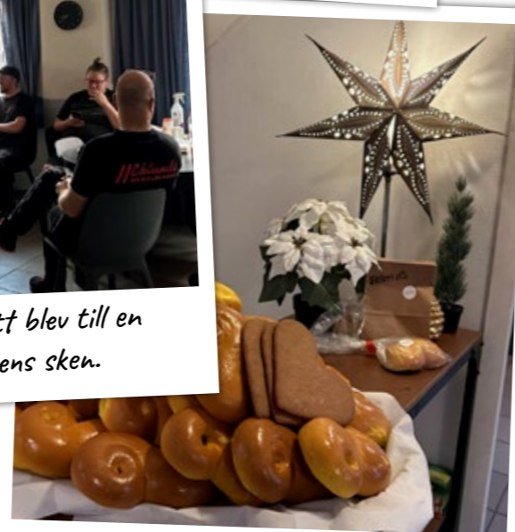
Luciamorgon firades med traditionsenligt finfika.