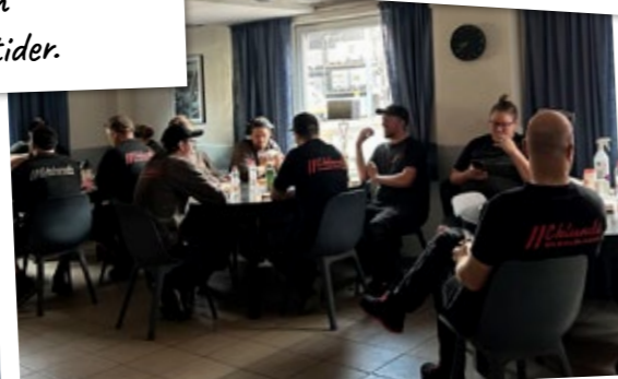
Långvarigt strömavbrott blev till en mysig frukost i värmeljusens sken.