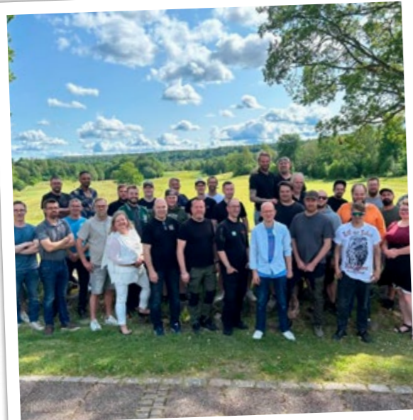
Storsamling med sommarlunch på Skövde GK inför semestertider.

Under året har vi gjort en lång rad aktiviteter för att utveckla våra medarbetare och därmed även företaget för att bibehålla positionen som Sveriges största bildemontering. Utan vårt fantastiska team hade det aldrig varit möjligt.